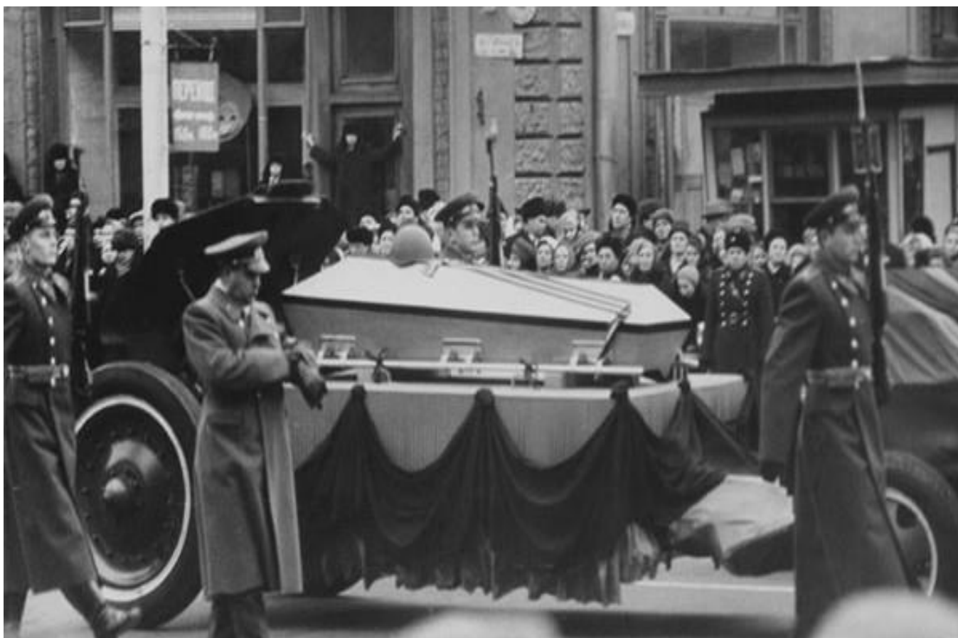
Траурный кортеж с прахом неизвестного солдата