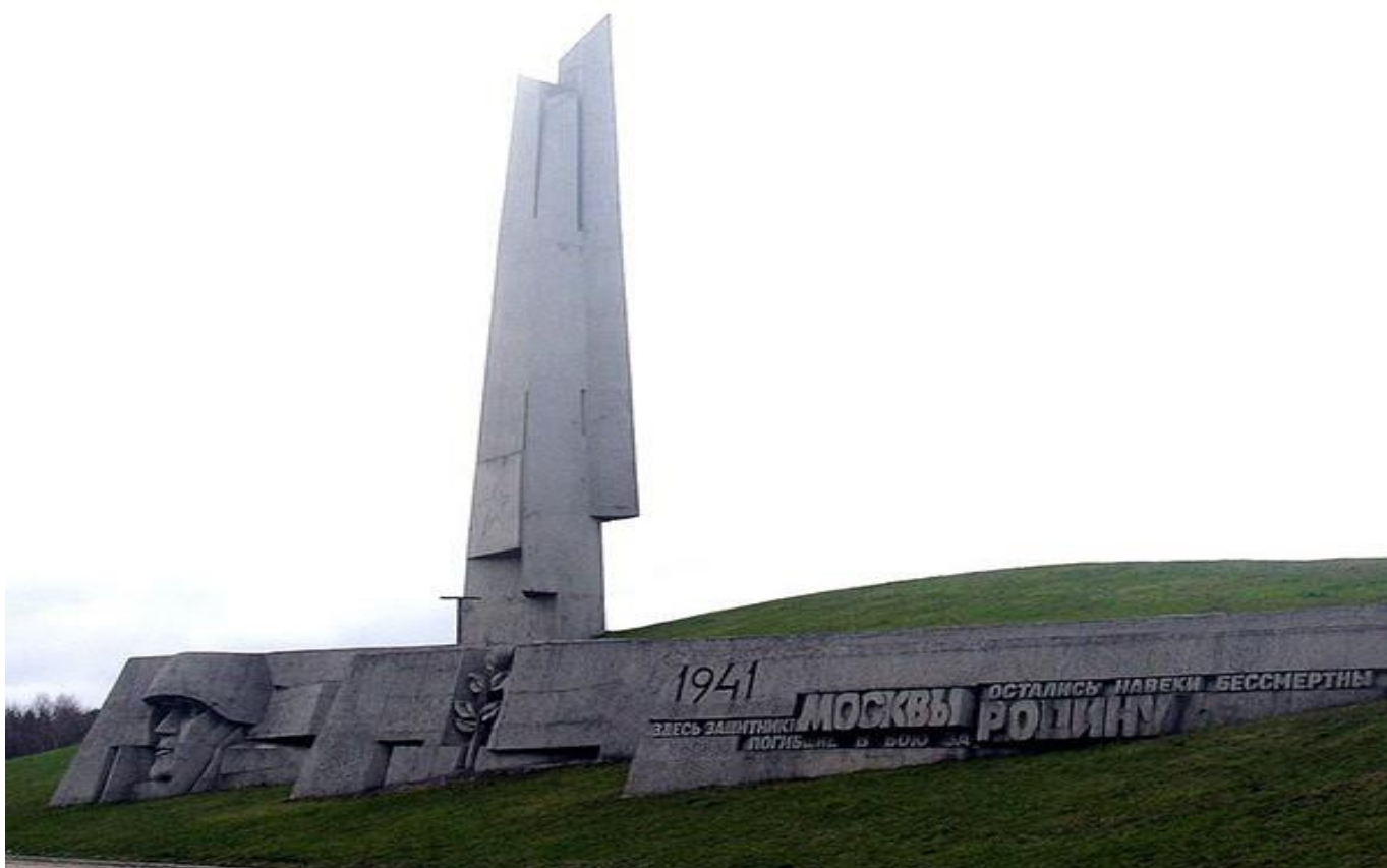
Мемориальный комплекс «Штыки» под Зеленоградом — братская могила, из которой был перенесен прах неизвестного солдата для захоронения в Москве