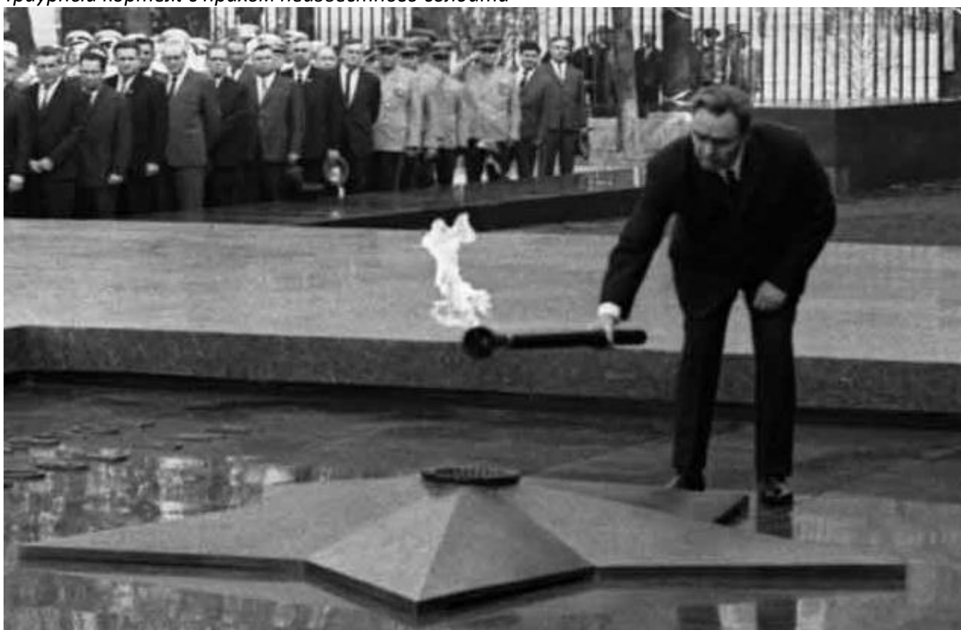
Вечный огонь был доставлен на бронетранспортере с военного мемориала на Марсовом поле в Ленинграде. Зажег его на Могиле Неизвестного солдата Леонид Брежнев, приняв факел из рук Героя Советского Союза Алексея Маресьева.